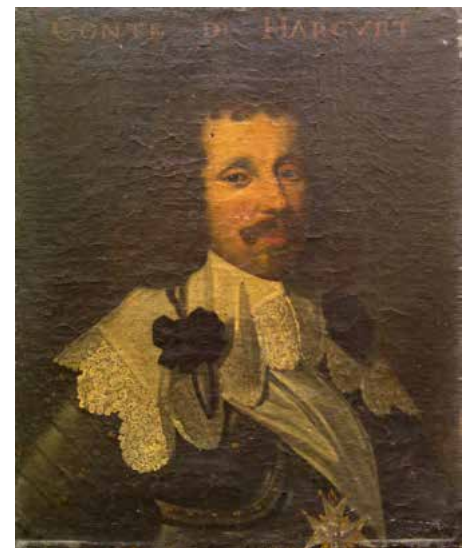
Portrait dit du Comte D'HARCOURT Époque XVII e - 61 x 50 cm