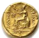
Statère or ALEXANDRE LE GRAND Poids : 9,03 g