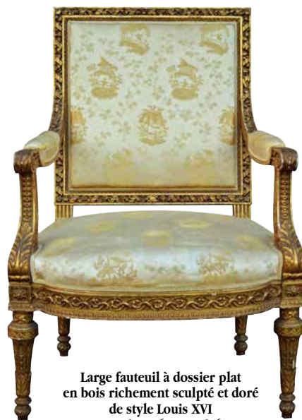
Large fauteuil à dossier plat en bois richement sculpté et doré de style Louis XVI Haut 97 - larg. 68 - prof. 61 cm