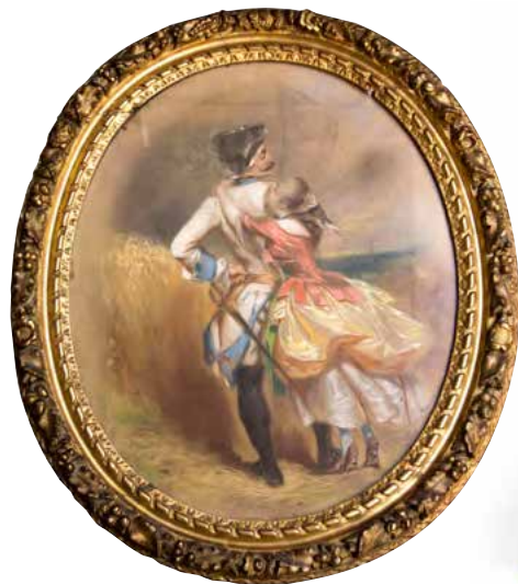
Eugène GIRAUD « La permission de dix heures » Paire de pastels - 72x58 cm