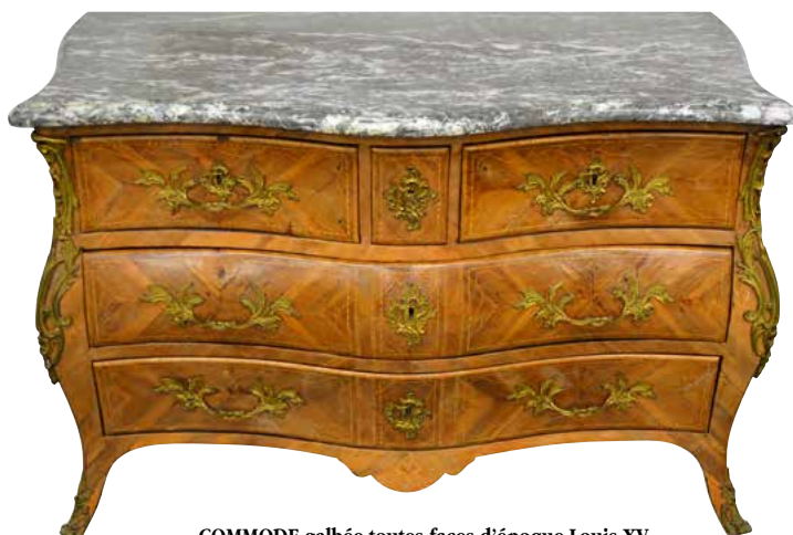
COMMUNE galbée toutes faces d'époque Louis XV Haut 82,5 - larg. 125 - prof. 70,5 cm