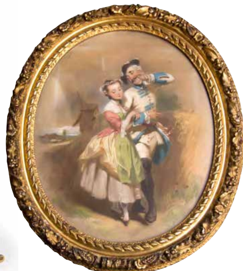
Eugène GIRAUD « La permission de dix heures » Paire de pastels - 72x58 cm