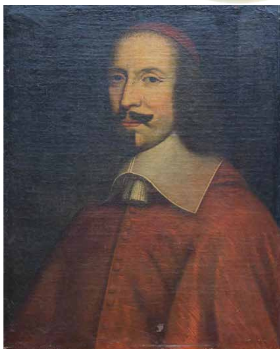
Portrait du cardinal MAZARIN Époque XVII e - 61 x 50 cm