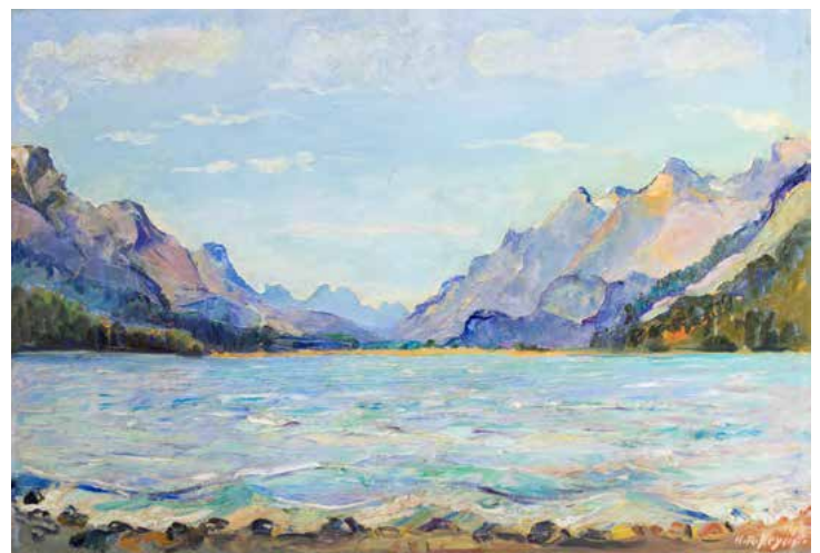
Hans Rudolf MEYER « Vue du lac de SILVAPLANA (Suisse) » peinture sur carton - 53,5 x 78 cm