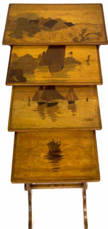
Émile GALLÉ - Table gigogne à décor de paysages marins