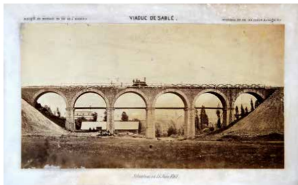
BISSON Frères, photographes : VIADUC DE LA SUZE et VIADUC DE SABLÉ : trois rares photographies