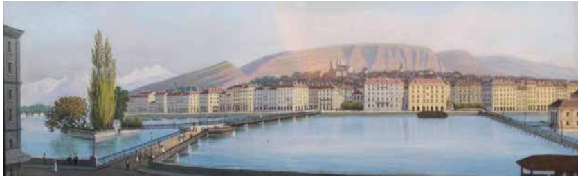
École Suisse du XIX e « Vue animée de la ville de GENÈVE » - Gouache - 8 x 28 cm