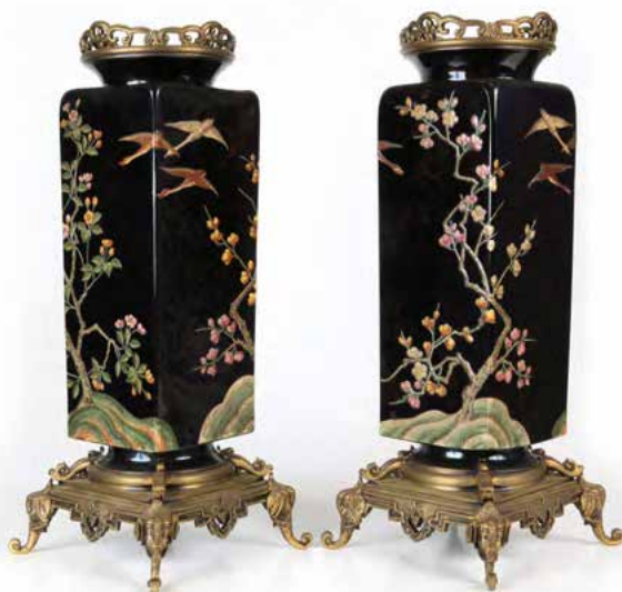
Paire de vases à décor japonisant - XIX e Haut. 37,5 cm