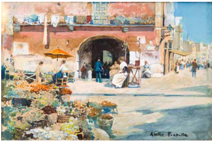
Attilio PRATELLA « Le marché aux fleurs » - 9 x 14 cm