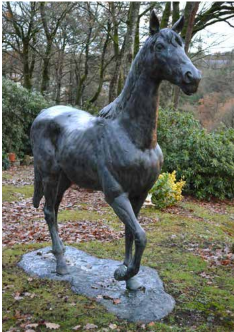
Importante sculpture en bronze patiné d'un cheval grandeur nature - Haut 227 cm