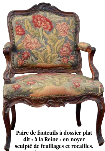
Paire de fauteuils à dossier plat dit « à la Reine » en noyer sculpté de feuillages et rocailles. Époque Louis XV Haut 97 - larg. 68 - prof. 57 cm