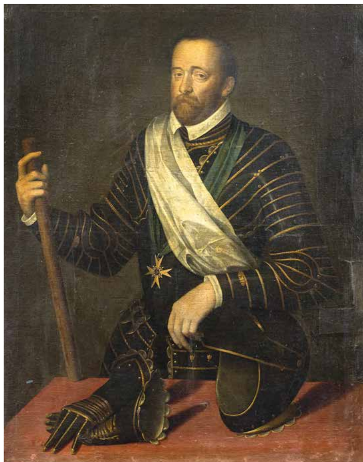
Pierre DUMONSTIER l'aîné (Paris vers 1543-1601) attribué à « Portrait de Philippe STROZZI (Florence 1541 - mer des Açores 1582) en armure portant l'Ordre de Saint-Michel » - Toile 115 x 87,5 cm Tableau visible chez l'expert Cabinet TURQUIN - 01 47 03 48 78