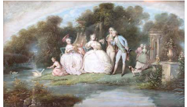
KAPPELER Joseph Damien « Réunion familiale dans un parc » Gouache - 19 x 31,5 cm