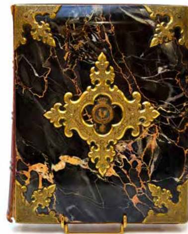
Bel album constitué de 103 portraits des membres de la famille de Napoléon III et de l'impératrice Eugénie