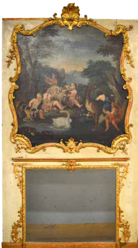
Trumeau de boiserie d'époque Louis XV en bois laqué et doré Haut 209 - larg. 122,5 cm