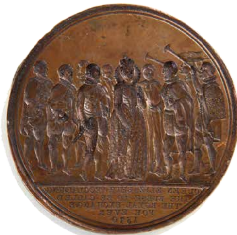
ELISABETH 1 re d'Angleterre, 1570 : 1 MATRICE pour la frappe d'une médaille. Diam. 6,2 cm