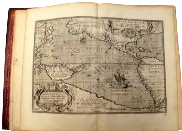
Abraham ORTELIUS : Atlas 1595