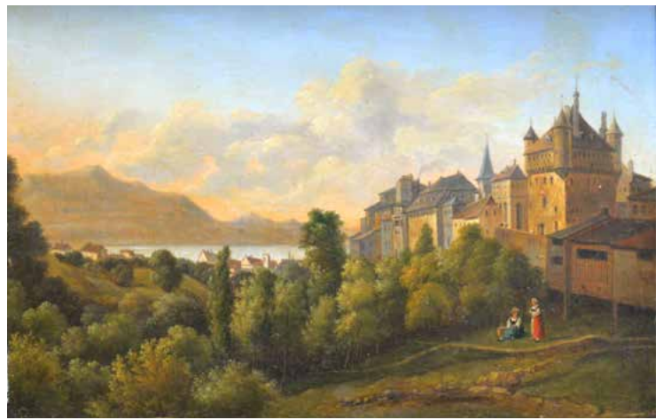
Vue de Lausanne (1830) signée De RON - 24,8 x 37,5 cm