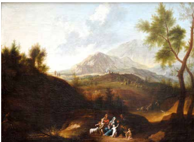
École FLAMANDE du XVIII e Sainte Famille dans un paysage - Toile 77 x 105 cm