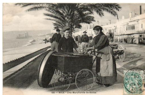
LOT N° 254