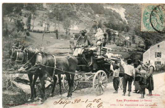
LOT N° 275