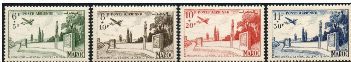
LOT N° 168