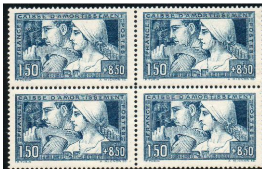
LOT N° 30