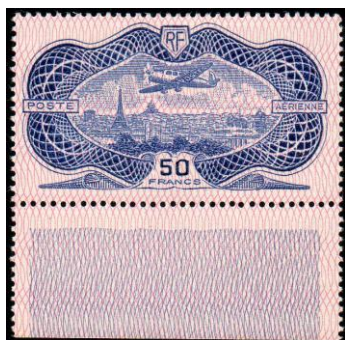
LOT N° 53