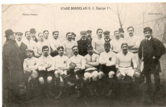
EX DU LOT N° 260