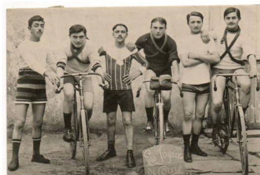
LOT N° 274