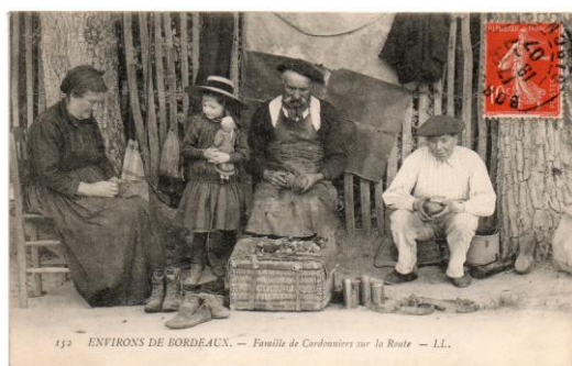
LOT N° 263