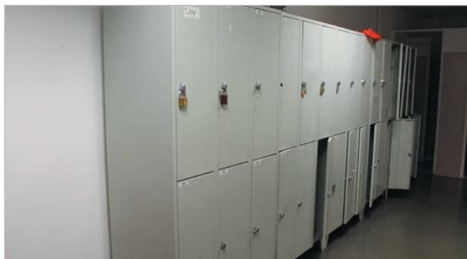
► Vestiaires ► Lockers

Ce dépliant photos ne présente qu'un échantillon des matériels proposés à la vente.