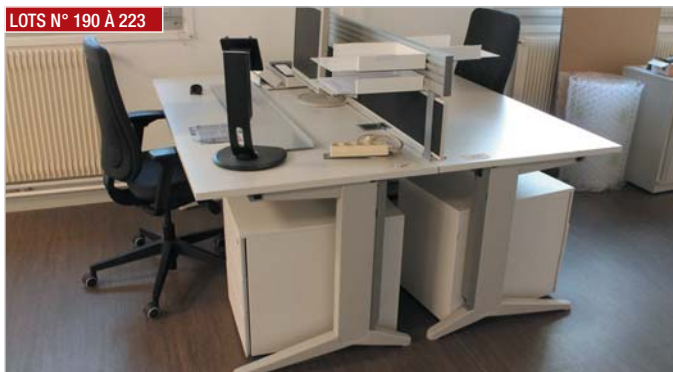
LOTS N° 190 À 223