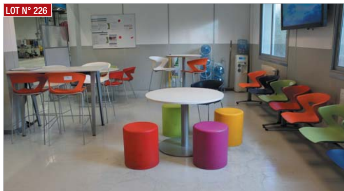
LOT N° 226