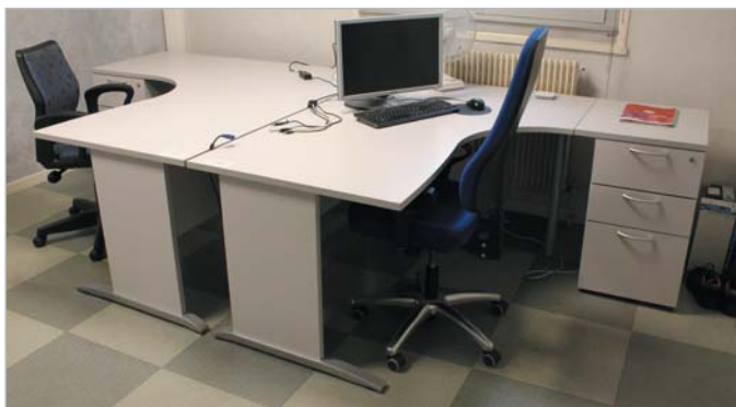
► Nombreux lots de mobilier de bureau ► Many batches of furniture