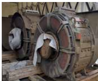
MOTEUR COMPLET TAB 674

Quantité : 1 Matière : Cuivre + Ferraille Poids unitaire en tonne : 7.5 Poids total en tonne : 7.5