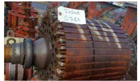
ROTOR-INDUIT - 6 FRA