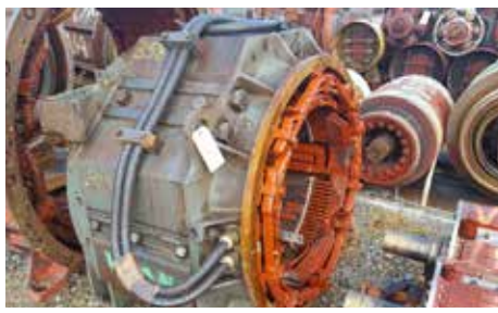
CARCASSE-STATOR - CTS