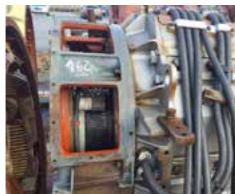
MOTEUR COMPLET CTS

Quantité : 1 Matière : Cuivre + Ferraille Poids unitaire en tonne : 7.5 Poids total en tonne : 7.5