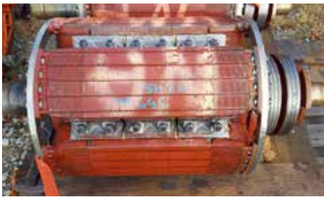
ROTOR-INDUIT - SM 47