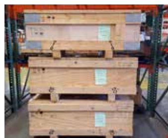
BARRES POUR BOBINES

Quantité : 1 Type : Cuivre Conditionnement : Benne Poids unitaire en tonne : 0.175 Poids total en tonne : 0.175