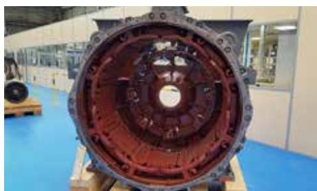
CARCASSE-STATOR - TAB 674