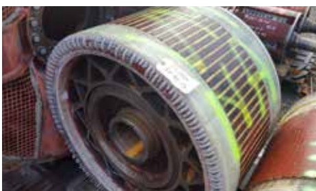
ROTOR-INDUIT - SW 9209