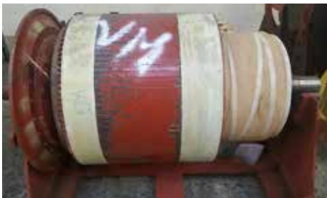
ROTOR-INDUIT - 668 -31