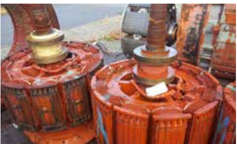
ROTOR-INDUIT - AT 108 - AT 85