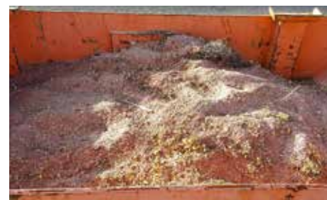
Copeaux cuivre + Mica

Quantité : 1 Type : Cuivre Conditionnement : Benne Poids unitaire en tonne : 0.44 Poids total en tonne : 0.44