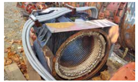
CARCASSE-STATOR - 6 FRA 4567