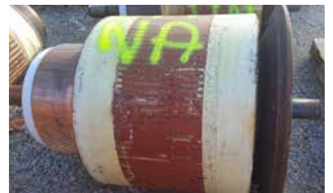
ROTOR-INDUIT - GD 803