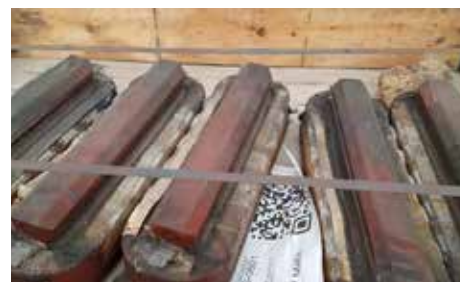
POLES AMORTISSEUR ROTOR

Quantité : 1 Type : Cuivre Conditionnement : Palette Poids unitaire en tonne : 0.36 Poids total en tonne : 0.36