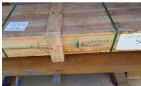
Barres H202 COLLECT.

Quantité : 1 Type : Cuivre Conditionnement : Caisse bois Poids unitaire en tonne : 4.705 Poids total en tonne : 4.705