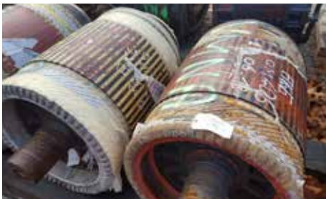
ROTOR-INDUIT - CTS