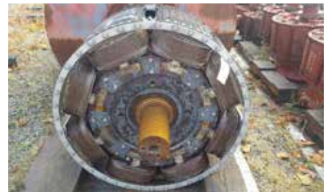
ROTOR-INDUIT - STS 105