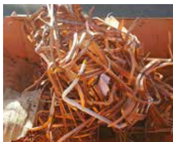
BARRES COUDEES BOBINES

Quantité : 2 Type : Cuivre Conditionnement : Caisses bois Poids unitaire en tonne : 0.175 Poids total en tonne : 0.35