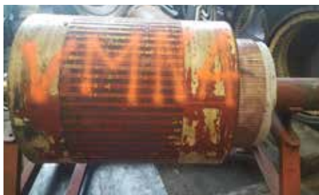
ROTOR-INDUIT - TAB 676