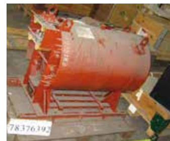
SELF DE LISSAGE

Quantité : 3 Matière : Cuivre + Ferraille Poids unitaire en tonne : 0.706 Poids total en tonne : 2.118