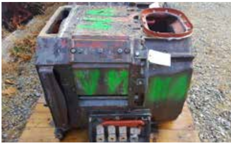
CARCASSE-STATOR - TAB 676