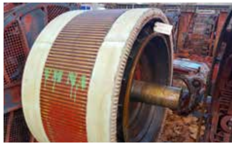
ROTOR-INDUIT - TAB 666