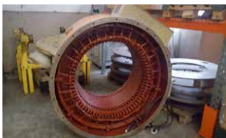
CARCASSE-STATOR - AT 108