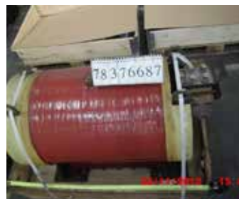
SELF DE LISSAGE

Quantité : 2 Matière : Cuivre + Ferraille Poids unitaire en tonne : 5.6 Poids total en tonne : 11.2