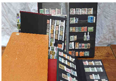
Lot 6 : Carton timbres du monde - dix classeurs neufs et oblitérés tous pays -

14H : CARTES POSTALES DES VILLAGES ET VILLES D'INDRE ET LOIRE (37) (1050 LOTS) EN LIVE