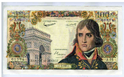
Lot 240 : France BILLET - CENT NOUVEAUX FRANCS BONAPARTE (Fy 59). 1er septembre 1960, SPLENDEIDE