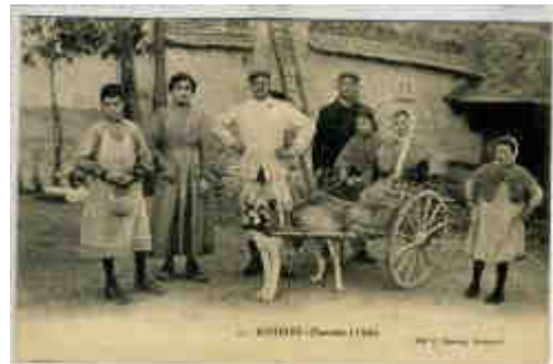
Lot 1665 : RESTIGNE (37) - RARE & CELEBRE CHARRETTE A CHIEN

• EXPOSITIONS chez l'expert, en ses locaux du 64 rue Michelet à Tours (37000) : Vendredi 22 juillet 2016, de 14h à 18h -et- Samedi 23 Juillet 2016, de 10h à 12h.