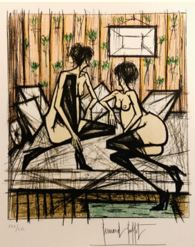
B. BUFFET : Jeu de dames , Paris - Sauret 1970. 10 lithos numérotées et signées

Atlas XVIII e - BOUCHER les annales d'Aquitaine 1643 - Le Code Noir 1788 - PERRONET Description des projets et de la construction des ponts... 1783 - Recueil de planches de l'Encyclopédie in-4 e - recueil de gravures, etc. Livres illus- trés dont B. BUFFET Jeu de dames - CENDRARS Rhap- sodies Gitanes ill. par Brayer - MÉRIMÉE Lettres de Madrid ill. par Brayer - GENEVOIX Rémi des Rauches ill. par Sou- las, etc. Histoire régionalisme dont bulletin de la société Dunoise, d'Eure et Loir - GUEDON de BERCHERE Voyage en Angleterre An V - LA BOESSIERE Traité de l'art des armes 1818, etc. Ensemble de livres sur la chasse et vé- nerie - Beaux-arts - Guide Michelin - Jules Verne, etc. Se- ront vendus à la suite un certain nombre de cartons de livres anciens et principalement XIX e