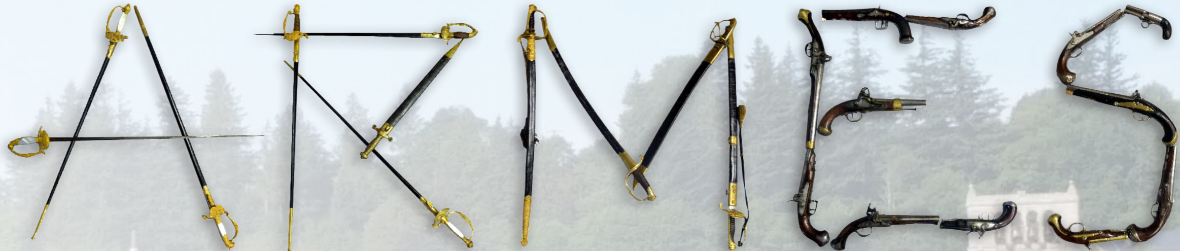
◀ VENTE DU 24 MARS ▶ Armes blanches et armes à feu du 1er Empire au Second Empire