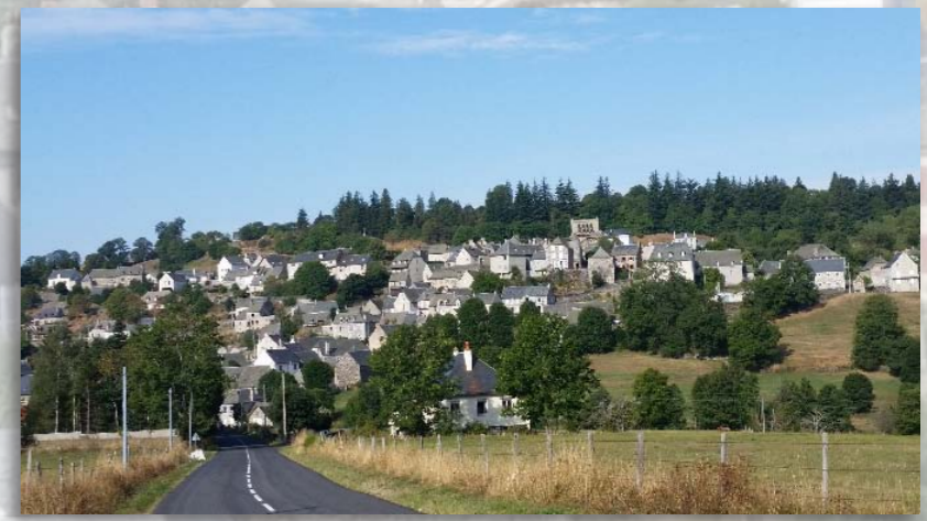
VENTES DES 11 ET 12 AOÛT ▶ St-Urcize dans l'Aubrac Bibelots, bijoux, tableaux