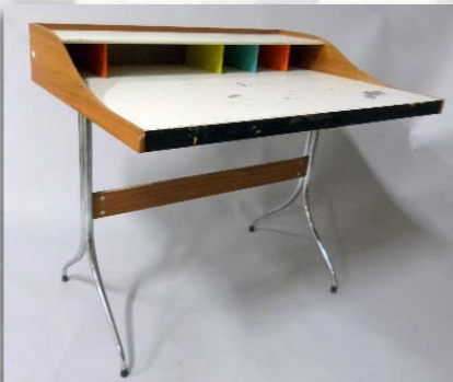
◀ Bureau de Georges NELSON , édition Herman Miller (circa 1970)