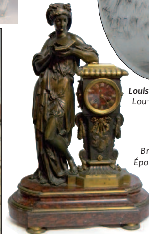
PENDULE. Bronze et marbre. Époque Restauration. H : 67 cm