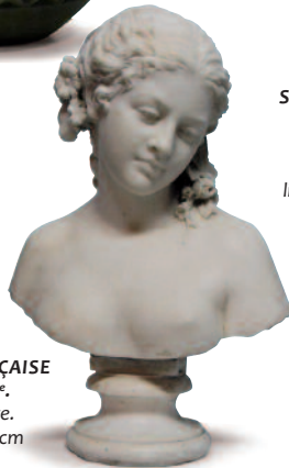
Ecole FRANÇAISE du XX e . Marbre. H : 58 cm