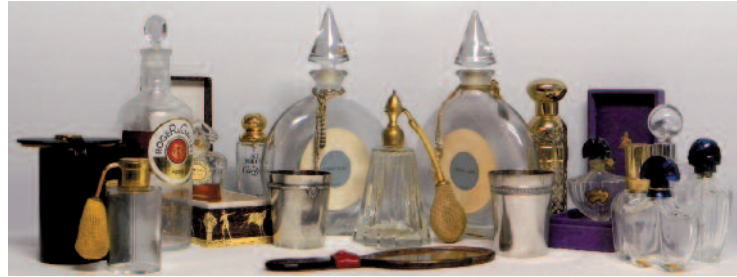
Ensemble de flacons de parfum GUERLAIN