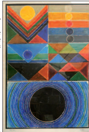
Sayed Haider RAZA. Ensemble de quatre lithographies