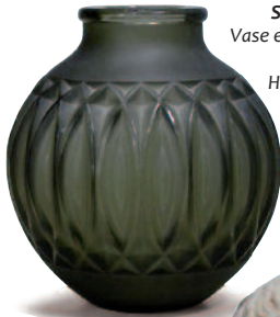
SABINO Vase en verre moulé. H : 25 cm