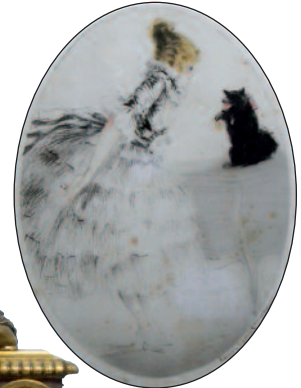
Louis ICART (1889-1950) Lou-Lou. Pointe sèche. H : 44,5 cm